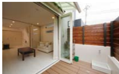
リビングにつながるデッキスペース。子どもが水遊びをしたり、家族で陽だまりを楽しむのに最適