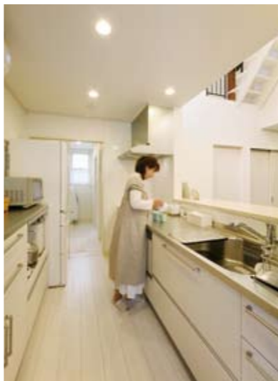
広い作業スペースを確保したキッチン。ご夫人のこだわり。「上部から光が差し込むので明るいです」