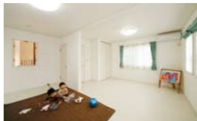
将来仕切って2室にできる子ども部屋。吹き抜けに面している壁には、インナーサッシを採用