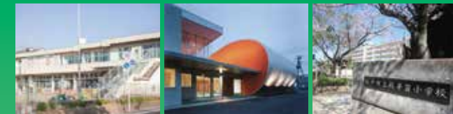
北小金保育園 徒歩10分(約725m) | 大勝院幼稚園 徒歩10分(約796m) | 殿平賀小学校 徒歩4分(約311m)