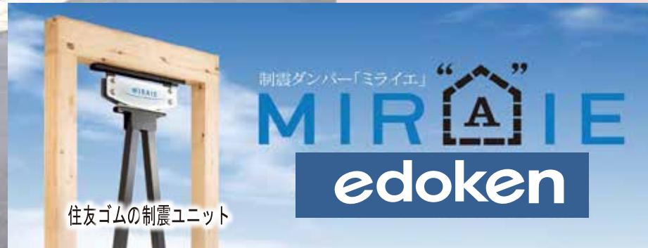
住友ゴムの制震ユニット