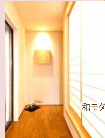
和モダンスタイル